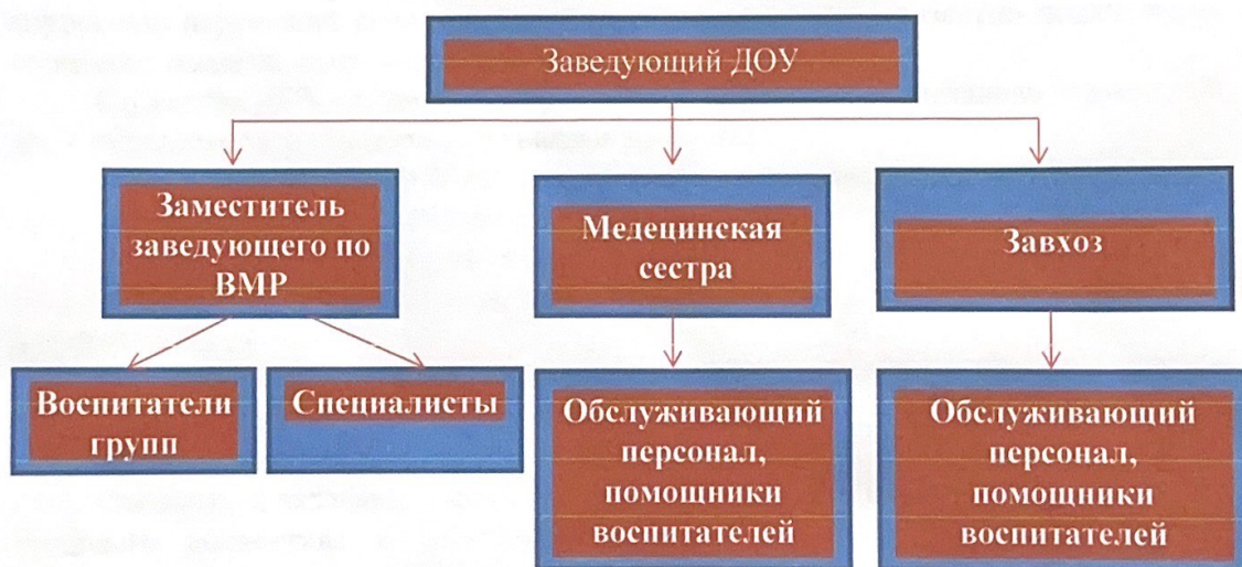
Схема. II направление – административное управление